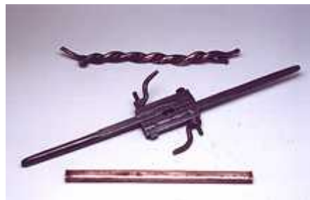
Chave para emenda e luva Utilização: efetuar a emenda por torção e unir dois cabos elétricos Fabricante: Oficinas Gerais da Light Acervo Fundação Patrimônio Histórico da Energia de São Paulo

Esta exposição esteve no Memorial do Imigrante até março de 2001. Consultas sobre o assunto podem ser realizadas no Núcleo de Documentação e Pesquisa. Rua do Lavapés, 463, Cambuci - São Paulo, SP Telefone: (11) 3276-4747