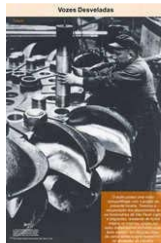
As vozes desveladas dos trabalhadores imigrantes com sons ilustrativos de atividades de trabalho.