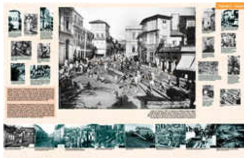
Cenas de trabalho de remodelagem das linhas de bonde no Largo do Tesouro, 1902.