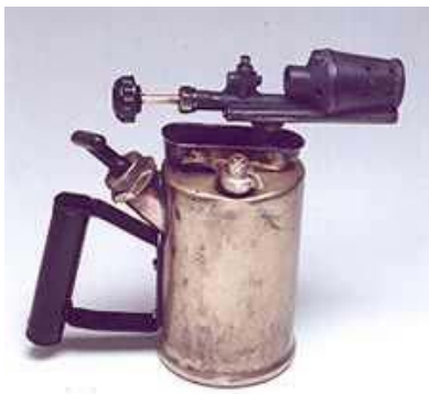
Maçarico em latão, ferro e baquelite Utilização: soldar cabos elétricos Fabricante: Voraz Anos 30 - século XX - Iugoslávia Acervo Fundação Patrimônio Histórico da Energia de São Paulo