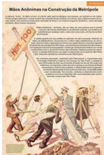
São Paulo guarda sob seu asfalto um passado de pás e enxadas.

Confira abaixo através de fotografias, recortes de jornais, cartazes publicitários e objetos, uma homenagem aos trabalhadores de São Paulo.