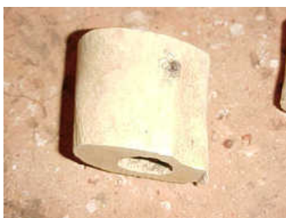
Fragmento de osso bovino

As outras modificações encontradas refletem a presença de animais de estimação (ossos mastigados por cães, por exemplo), a exposição ao fogo para o cozimento da comida ou mesmo a queima de lixo.