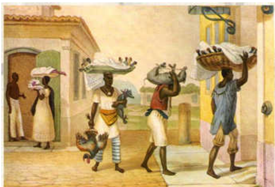
Transporte de animais por ocasião dos festejos de Natal. DEBRET, Jean Baptiste. Viagem pitoresca e histórica ao Brasil. Belo Horizonte: Itatiaia, São Paulo: Edusp, 1989. Tomo 3, prancha 25.

Transporte de animais por ocasião dos festejos de Natal. (DEBRET, Jean Baptiste. Viagem pitoresca e histórica ao Brasil . Belo Horizonte: Itatiaia, São Paulo: Edusp, 1989. tomo 3, prancha 25)