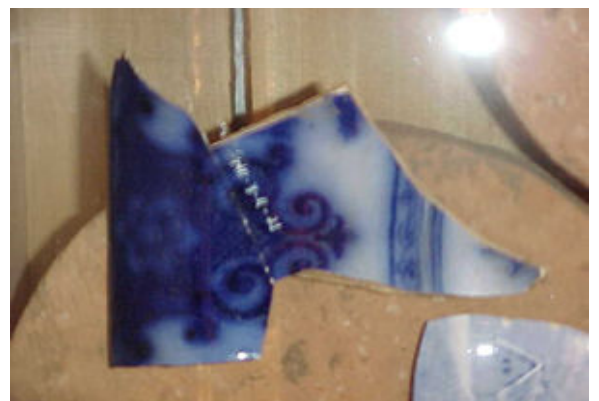
Fragmento de faiança inglesa "Azul Borrão". Todo o século XIX e início do século XX