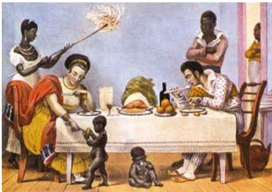
O jantar no Brasil. DEBRET, Jean Baptiste. Viagem pitoresca e histórica ao Brasil. Belo Horizonte: Itatiaia, São Paulo: Edusp, 1989. Tomo 2, prancha 7.

O jantar no Brasil, de Jean Baptiste Debret