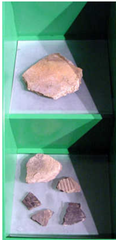
Cerâmica regional de qualidade inferior

Referência: ZANETTINI, Paulo Eduardo. Prospecções arqueológicas no quintal do Museu da Energia Itu - São Paulo . São Paulo: 1999. p. 22