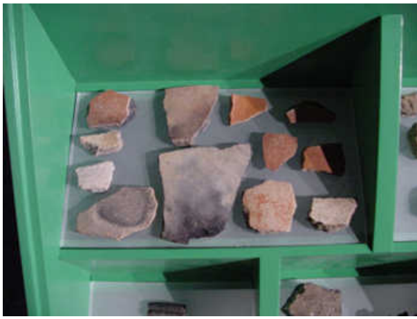
Cerâmica regional de qualidade superior