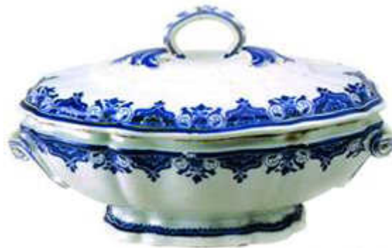
Faiança monocromada (azul) fabricada no Porto, último quartel do século XVIII. (FUNDAÇÃO DO ESPÍRITO SANTO SILVA. Faianças portuguesas. Lisboa: 1998. p. 103)

A atividade arqueológica realizada no quintal do Museu da Energia em Itu coletou quantidade significativa de faianças portuguesas com motivos decorativos de inspiração chinesa, em azul sobre esmalte branco (acima), característica dos séculos XVII e XVIII. A introdução de novas técnicas de queima das peças em fins do século XVIII conduziu a uma maior diversificação nas cores, multiplicando-se a faiança policromada. As formas também se diversificaram, dando origem a vasos, floreiras, canecas e peças maiores.