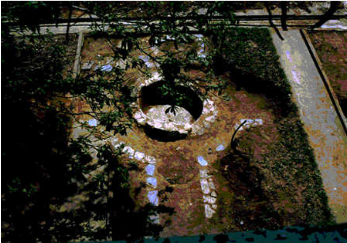
O jardim redescoberto durante a prospecção arqueológica, 1999.

A prospecção arqueológica Museu da Energia de Itu foi realizada em março de 1999 pelo arqueólogo Paulo Zanettini e sua equipe. As sondagens no jardim e a abertura de trincheiras no interior do edifício trouxeram à tona informações importantes na reconstrução da história do edifício, como a descoberta de indícios de outros dois jardins, subjacentes ao existente na época de escavação.