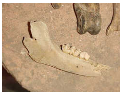
Fragmento de mandíbula