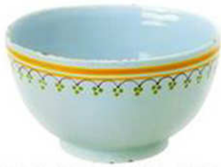
Faiança policromada, segundo quartel do século XIX. (FUNDAÇÃO DO ESPÍRITO SANTO SILVA. Faianças portuguesas. Lisboa: 1998. p. 129)