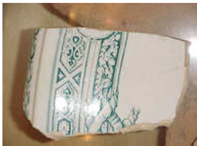
Padrão Green Edge

O padrão Willow (Pombinhos) era a louça inglesa mais comum e de menor custo e o Azul Borrão, a mais cara. Entre esses dois extremos encontramos os padrões Green Edge e o Blue Edge , paisagens inspiradas nos cenários ingleses e italianos.