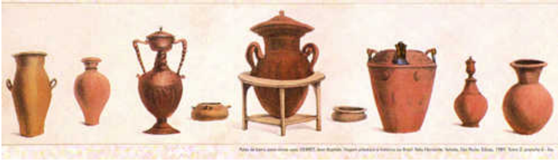
Potes de barro para vários usos (DEBRET, Jean Baptiste. Viagem pitoresca e histórica ao Brasil . Belo Horizonte: Itatiaia, São Paulo: Edusp, 1989. tomo 2, prancha 6-bis)

As pesquisas arqueológicas permitiram definir dois grandes grupos de louças de cerâmica. Nas camadas mais profundas, mais antigas, foram encontradas louças de barro com maior qualidade técnica e esmero na decoração. Eram feitas com argila de grãos finos e os motivos decorativos sugerem influências indígena e africana.