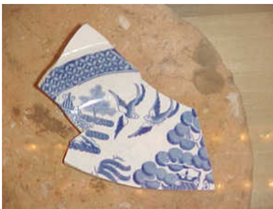
Fragmento de faiança inglesa com padrão decorativo "Pombinhos"

A introdução do decalque como técnica de impressão, criada na Inglaterra, barateou o preço da louça inglesa e levou os fabricantes da região de Staffordshire a conquistar mercados em todo o mundo. A técnica do decalque permitiu que fossem impressos padrões absolutamente iguais, popularizando os famosos Pombinhos e o Azul Borrão.