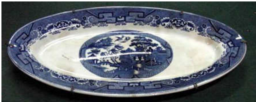
Travessa com padrão decorativo "pombinhos". Esse padrão foi produzido entre o fim do século XVIII e a primeira metade do século XIX.

A introdução do decalque como técnica de impressão, criada na Inglaterra, barateou o preço da louça inglesa e levou os fabricantes da região de Staffordshire a conquistar mercados em todo o mundo. A técnica do decalque permitiu que fossem impressos padrões absolutamente iguais, popularizando os famosos Pombinhos e o Azul Borrão.