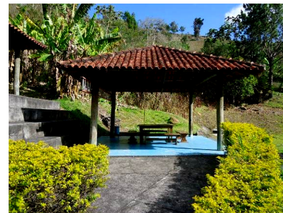
Praça de Acolhimento 2