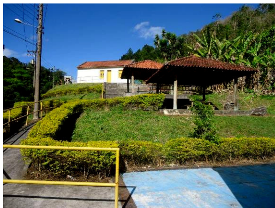
Auditório e Praça de Acolhimento